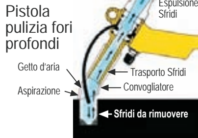
Pistola pulizia fori profondi